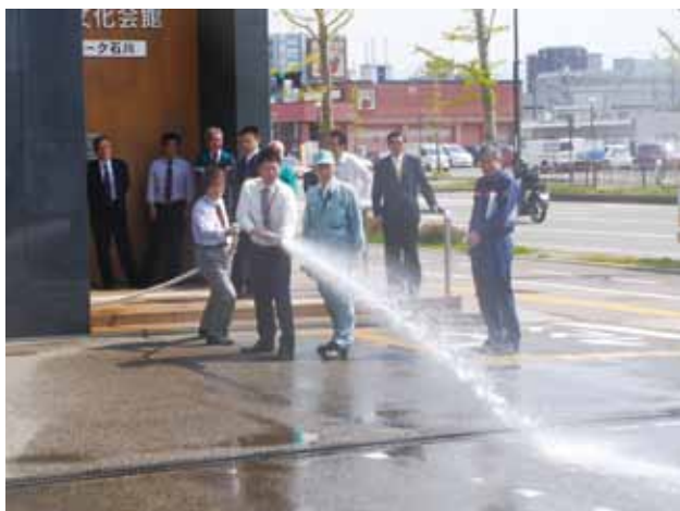
屋内消火栓を使った放水訓練

フレンドパーク石川は、4月25日(金)法定の防火避難訓練を会館入居者の協力を得て開催した。