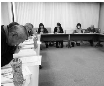
資料を食い入るように確認する参加者

県ライフ・サポートセンターは、3月6日(火)金沢市西念の労済会館会議室において、9回目となるLSC 事務担