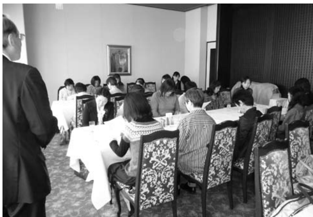
緊サポ「サポート会員交歓会」