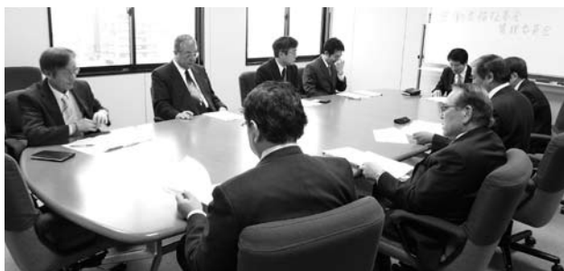
福祉基金管理委員会

第9回労働者福祉基金管理運営委員会が、4月15日(金)フレンドパーク石川で委員9名が出席して開催された。