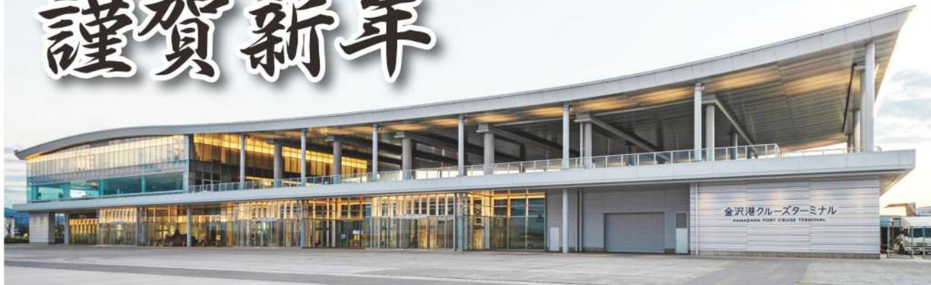
金沢港クルーズターミナル