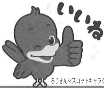
ろうきんマスコットキャラクター「ロッキー」