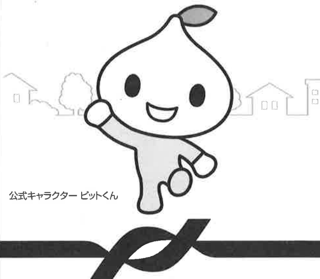
公式キャラクター ビットくん