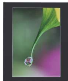
金沢市長賞『一雫』 泉谷 桂子(かほく市)