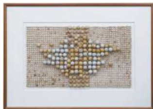
石川県知事賞『集積回路』 川崎 晴夫(白山市)