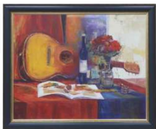
厚生労働大臣賞『想い』 高山 静子(津幡町)