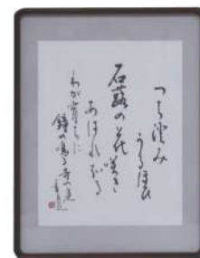
金沢市長賞『寺の庭』 寺西 香月(内灘町)