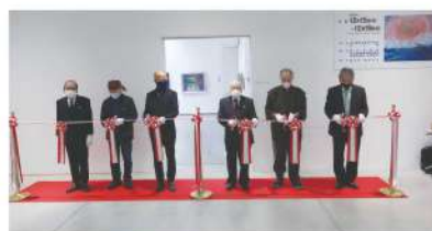
開会式・テープカット

後各部門の厚生労働大臣賞、県知事賞、県議会議長賞受賞15作品を展示した県庁特別展も従来通り開催されて来訪者の目を楽しませた。