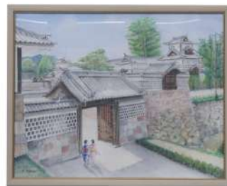
金沢市長賞『金沢城』 高木 邦雄(金沢市)