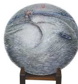
金沢市長賞『夢の中へ』 広川 みのり(内灘町)