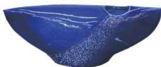
厚生労働大臣賞『永遠に』 宮本 麻里子(金沢市)