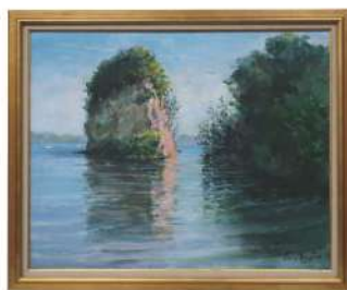
勤文協会会長賞『朝焼け そわじ浦』 表 辰祐(中能登町)