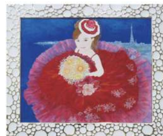
金沢市長賞「mon rêve (私の夢)」 末友 恵子(能美市)