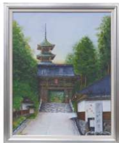
石川県知事賞『古寺名利』 田村 英昭(金沢市)