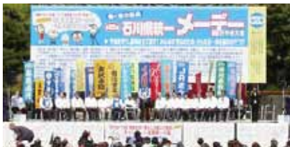
昨年のメーデー金沢中央大会

第87回石川県統一メーデーの県内開催に向けた実行委員会は、連合石川及び各地域協議会、労福協、北陸労金、全労済石川、石川労信協、石川生協連、勤体協、勤文協、さわやかUの全事業団体が加わり、2月4日(木)に第1回、3月31日に第2回を開催した。